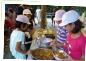
かまど作りから始める野外炊飯。 みんなで協力して、おいしいカレーができました!